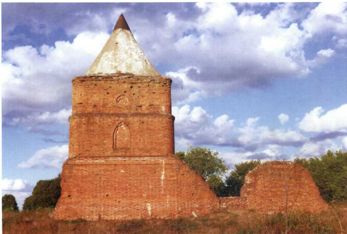
Фото 9. Ансамбль Сабуrowsкой крепости: б) Четыре башни. XVIII в. 12.06.2010 г. Западная стена и коническая башня. Вид с запада.