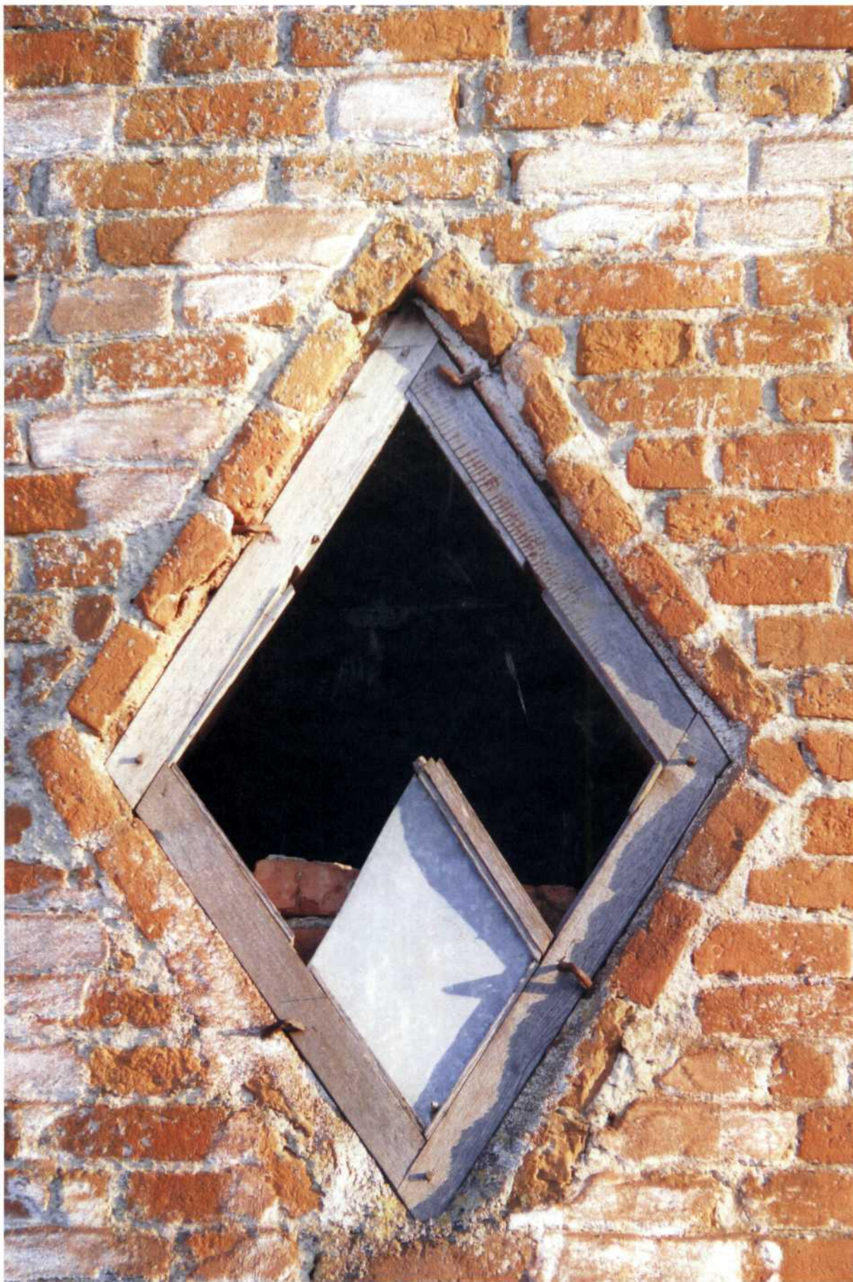
Фото 3. Ансамбль Сабуровской крепости: б) Четыре башни. XVIII в. 12.06.2010 г. Окно круглой башни. Вид с запада.