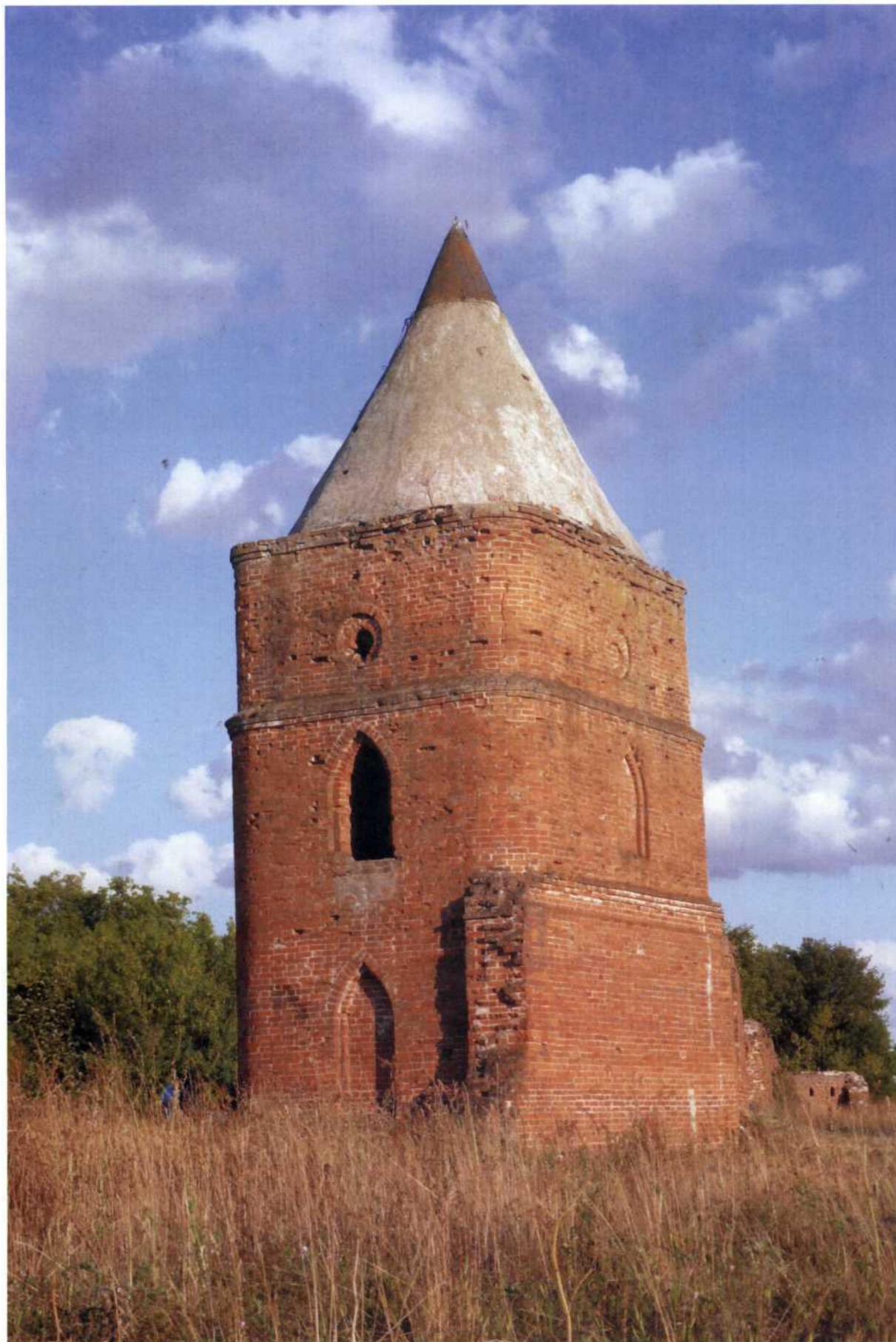
Фото 10. Ансамбль Сабуровской крепости: б) Четыре башни. XVIII в. 12.06.2010 г. Коническая башня. Вид с северо-запада.