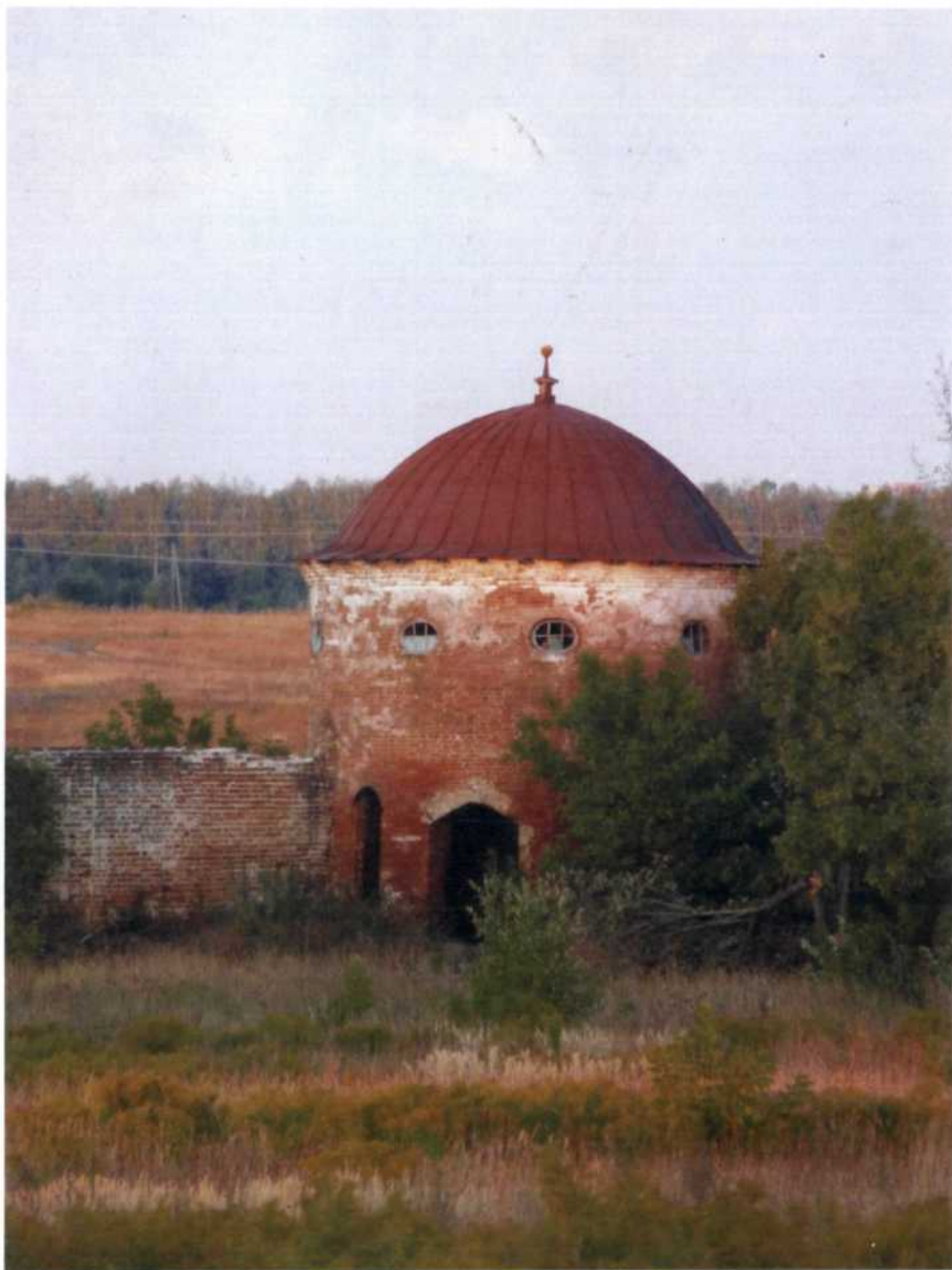
Фото 1. Ансамбль Сабуровской крепости: б) Четыре башни. XVIII в. 12.06.2010 г. Круглая юго-восточная угловая башня с внутренней стороны крепости. Вид с юго-запада.