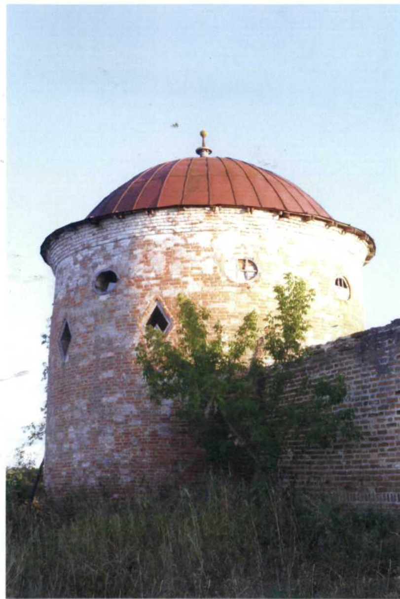
Фото 2. Ансамбль Сабуровской крепости: б) Четыре башни. XVIII в. 12.06.2010 г. Круглая юго-восточная башня. Вид с северо-востока.