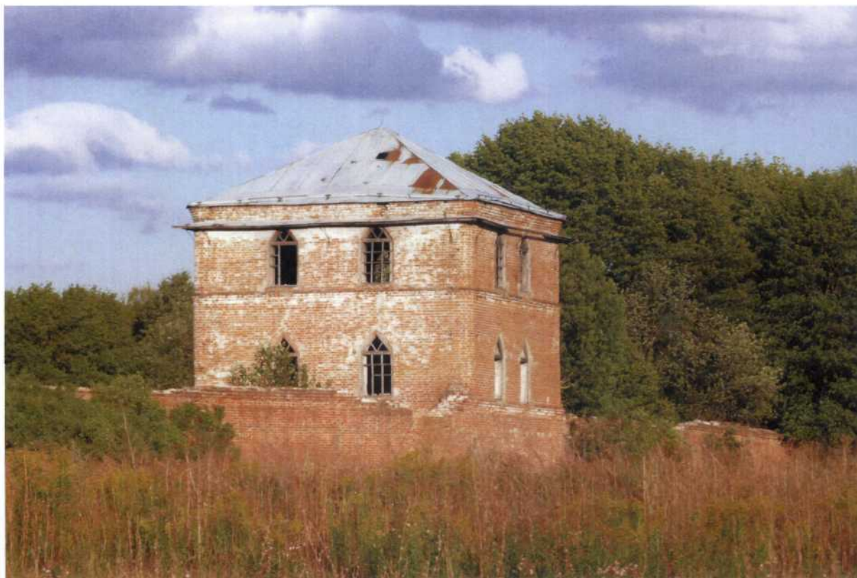
Фото 6. Ансамбль Сабуровской крепости: б) Четыре башни. XVIII в. 12.06.2010 г. Трехэтажная башня и часть западной стены. Вид с северо-запада.