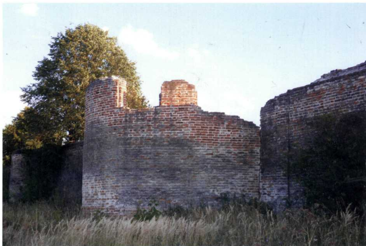
Фото 5. Ансамбль Сабуровской крепости: б) Четыре башни. XVIII в. 12.06.2010 г. Разрушенная треугольная башня восточной стены. Вид с северо-востока.