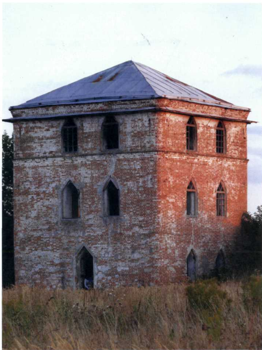
Фото 7. Ансамбль Сабуровской крепости: б) Четыре башни. XVIII в. 12.06.2010 г. Трехэтажная башня. Вид с внутренней стороны крепости с северо-востока.