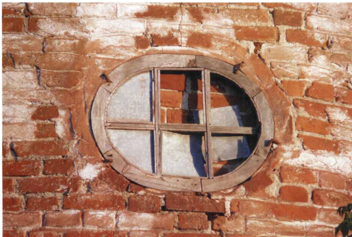
Фото 4. Ансамбль Сабуровской крепости: б) Четыре башни. XVIII в. 12.06.2010 г. Окно круглой башни. Вид с юго-запада.