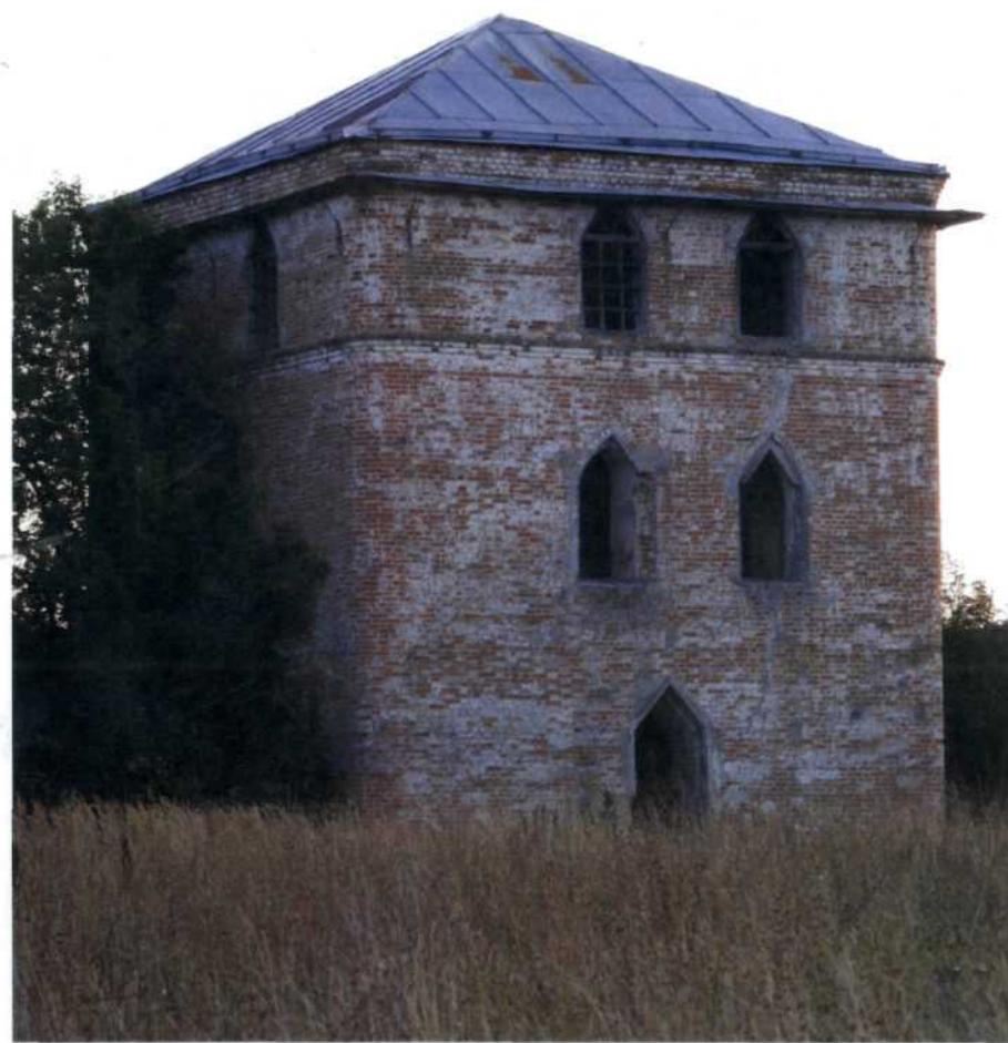
Фото 8. Ансамбль Сабуровской крепости: б) Четыре башни. XVIII в. 12.06.2010 г. Трехэтажная башня с внутренней стороны крепости. Вид с востока.