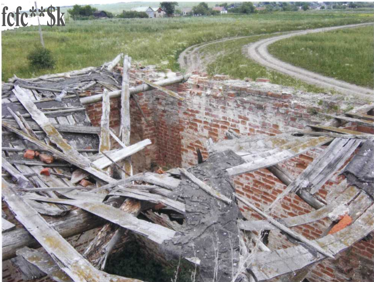
Фото 5. Ансамбль Сабуровской крепости: д) Амбар. XVIII в. 12.06.2010 г. Вид с юго-запада.