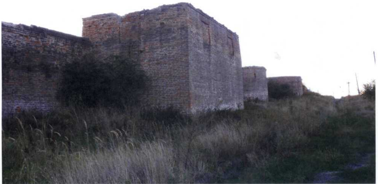
Фото 3. Ансамбль Сабуровской крепости: д) Амбар. XVIII в. 12.06.2010 г. Вид с юго-востока.