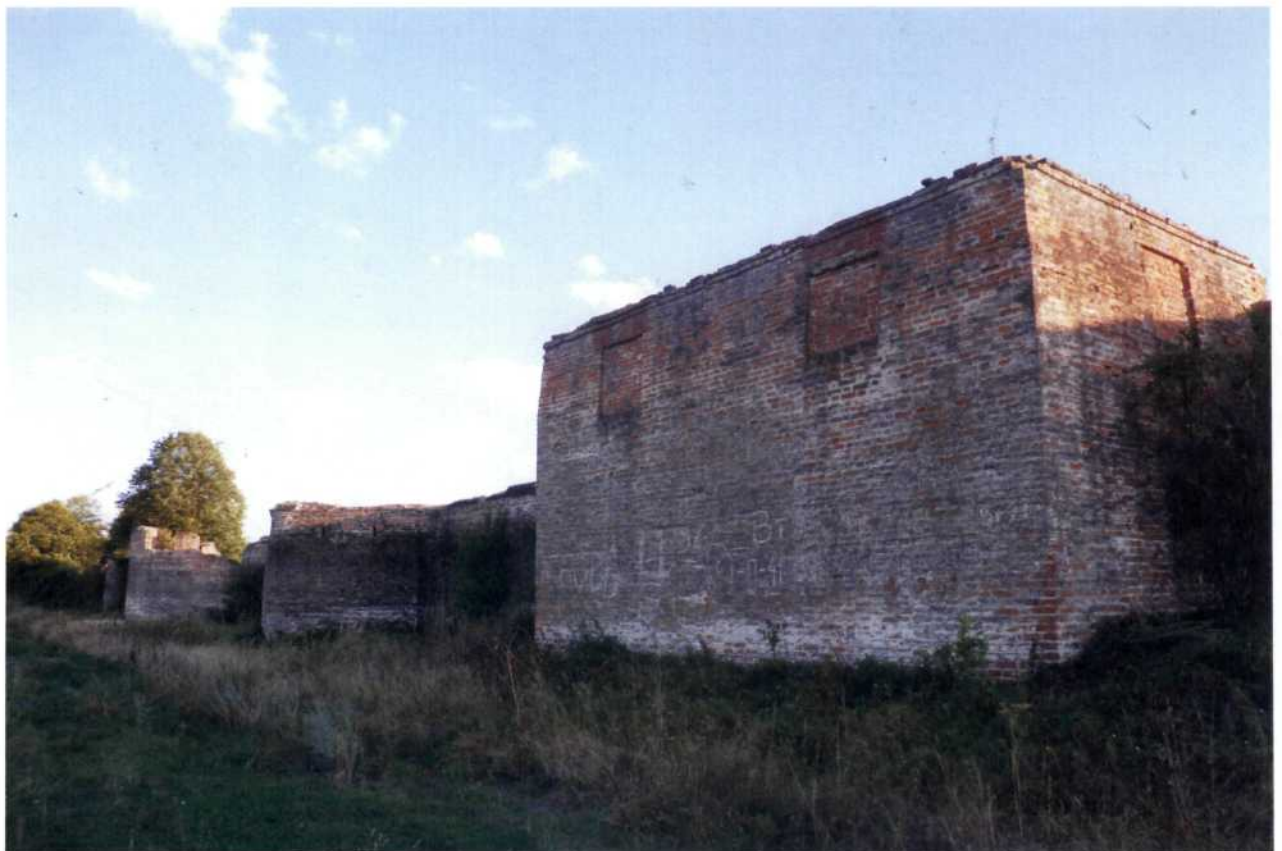
Фото 2. Ансамбль Сабуровской крепости: д) Амбар. XVIII в. 12.06.2010 г. Восточная стена. Вид с севера.