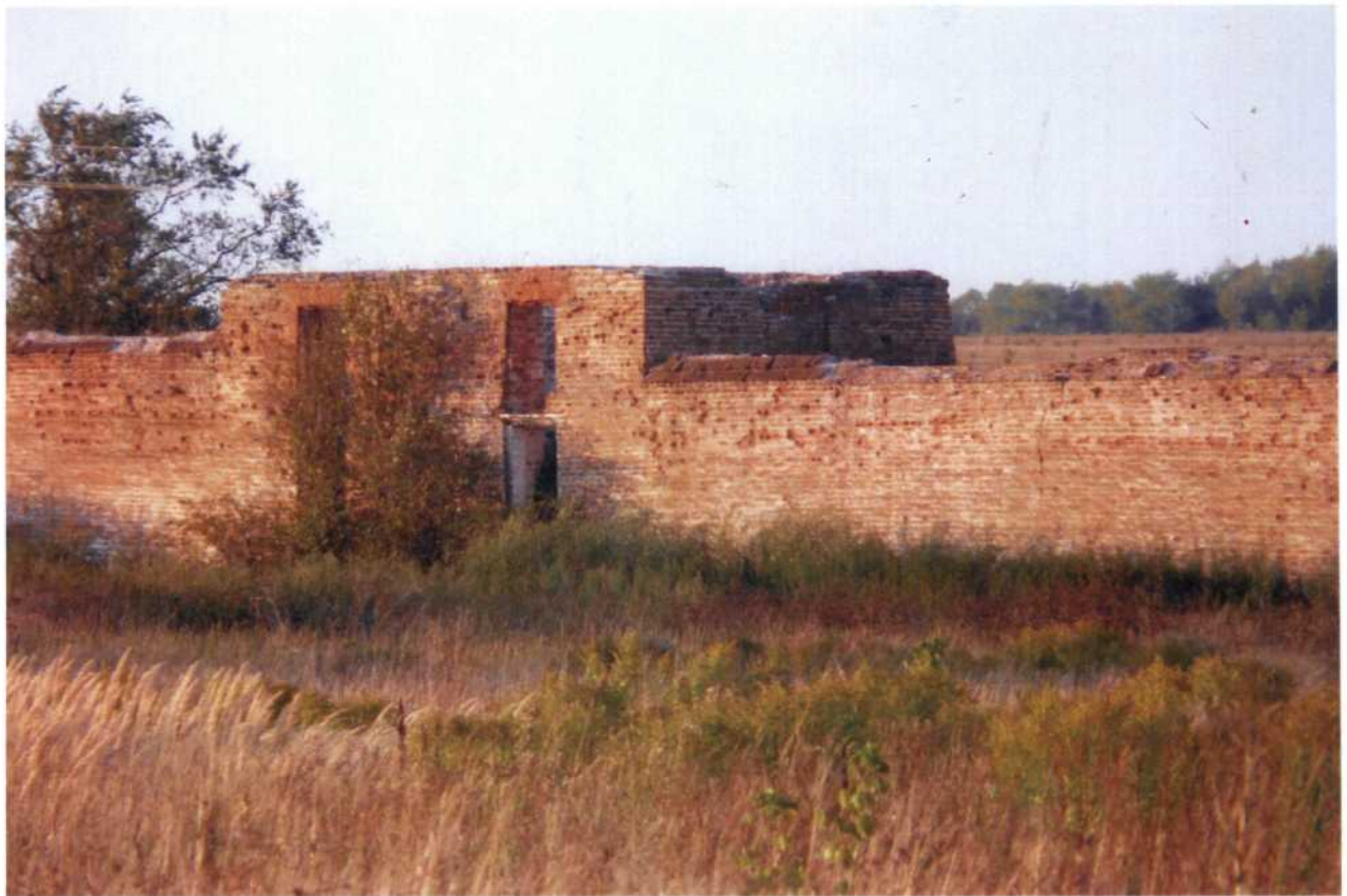
Фото 4. Ансамбль Сабуровской крепости: д) Амбар. XVIII в. 12.06.2010 г. Вид с юго-запада.