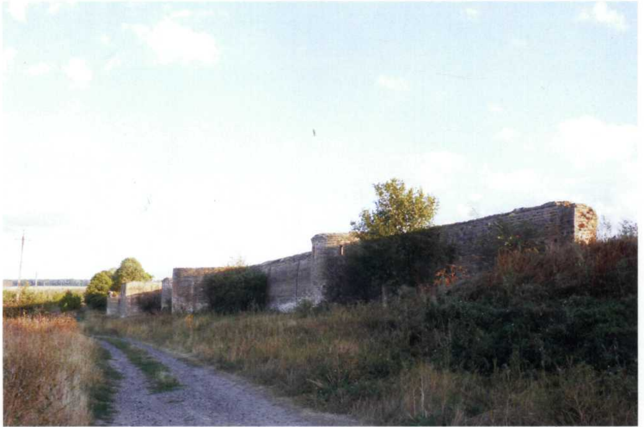
Фото 1. Ансамбль Сабуровской крепости: д) Амбар. XVIII в. 12.06.2010 г. Восточная стена. Вид с севера.