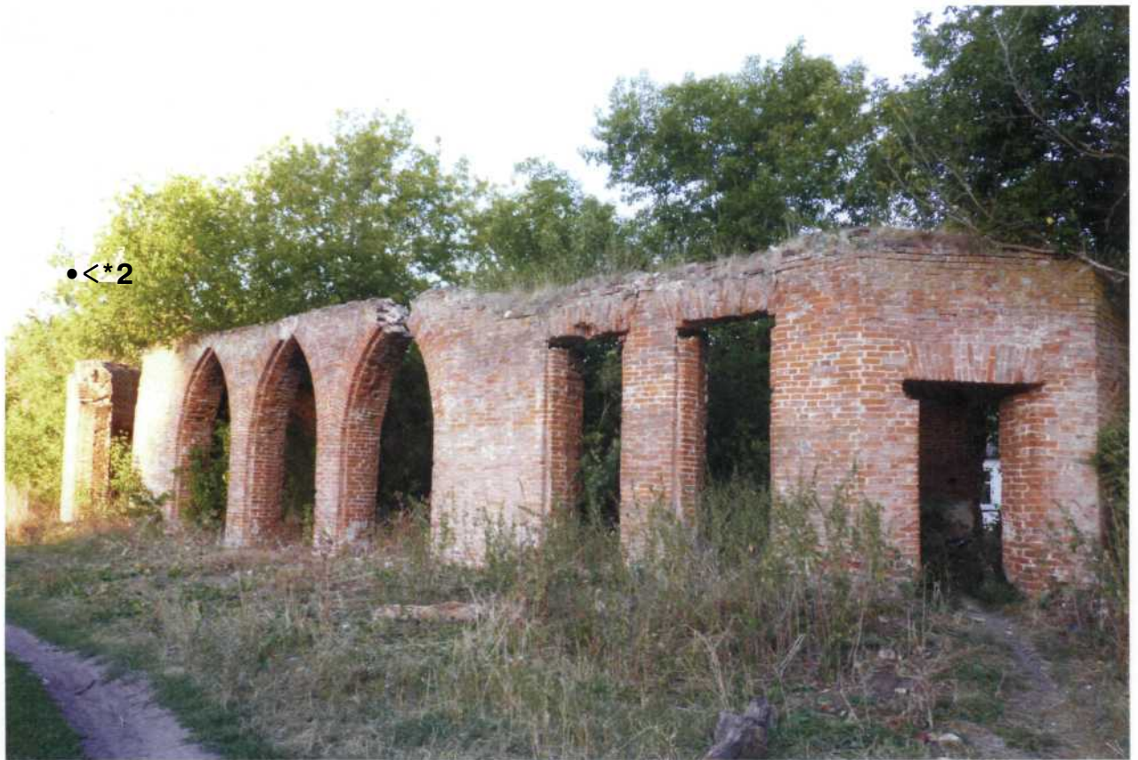
Фото 1. Ансамбль Сабуровской крепости: в) Здание театра. XVIII в. 12.06.2010 г. Вид с северо-запада.