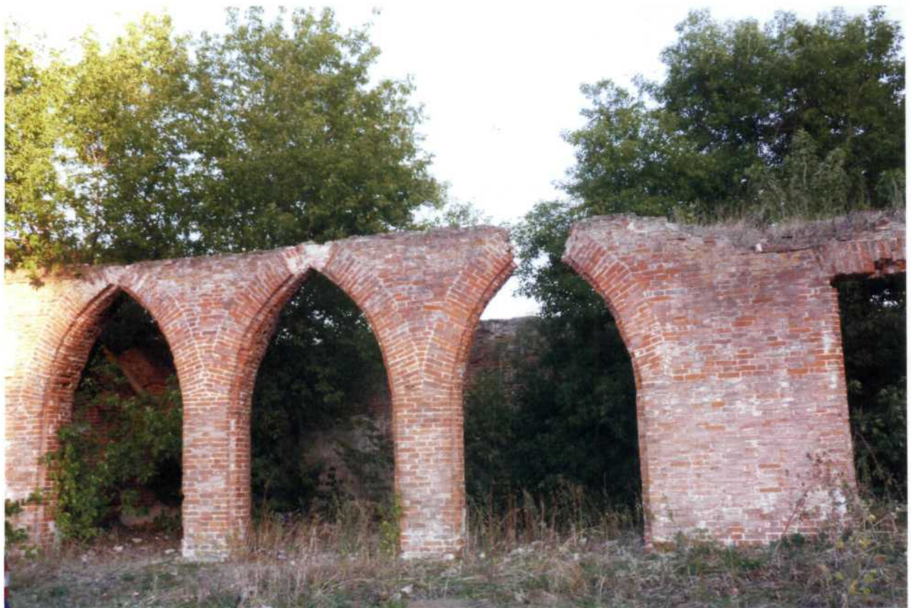
Фото 2. Ансамбль Сабуровской крепости: в) Здание театра. XVIII в. 12.06.2010 г. Арки. Вид с севера.