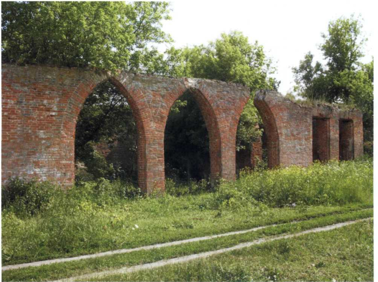
Фото 3. Ансамбль Сабуровской крепости: в) Здание театра. XVIII в. 12.06.2010 г. Вид с северо-востока.