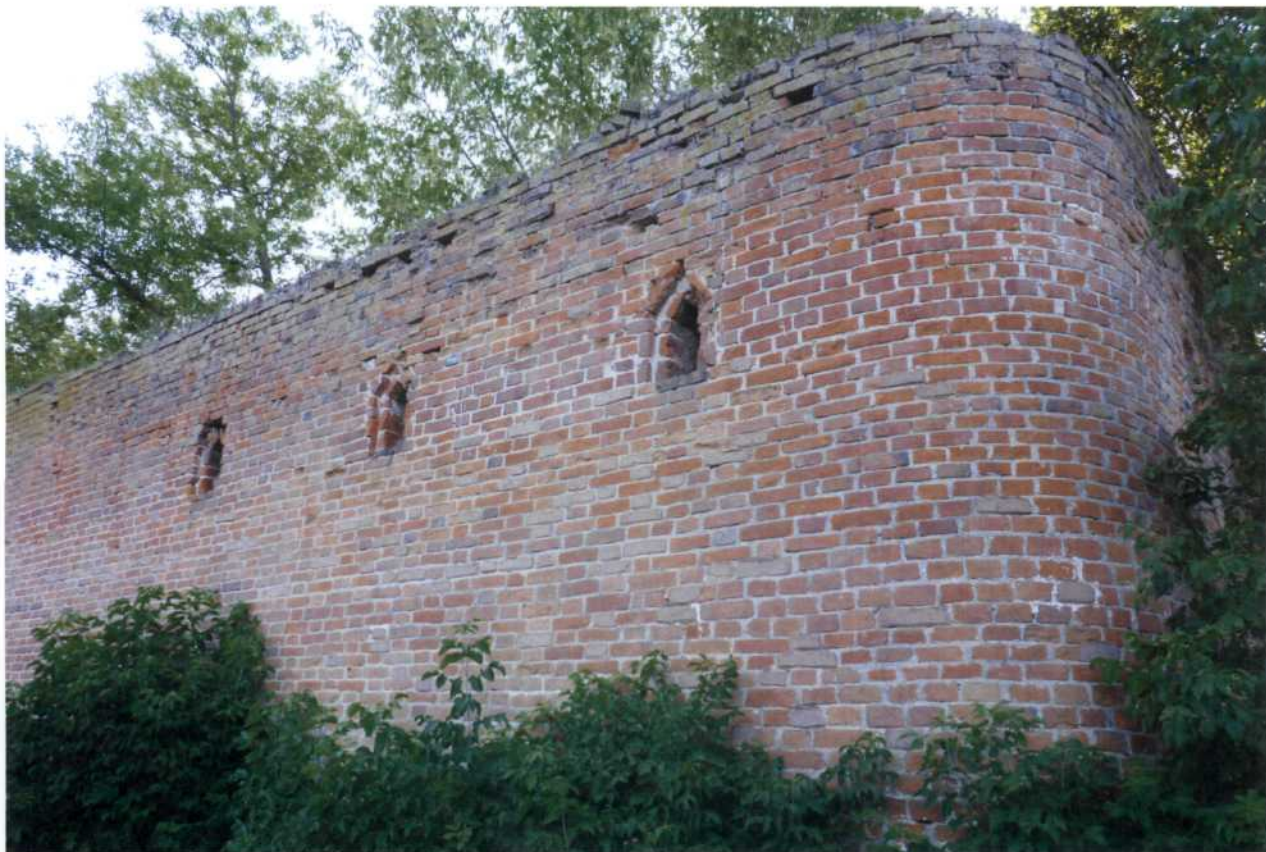
Фото 5. Ансамбль Сабуровской крепости: в) Здание театра. XVIII в. 12.06.2010 г. Вид с юго-востока со стороны южной стене.